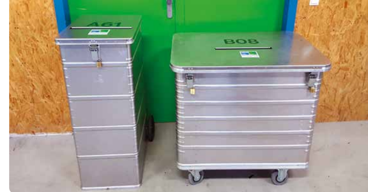
240 I ca. 30 Ordner