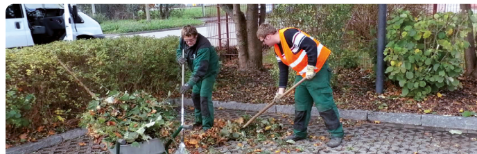
Garten- / Landschaftspflege